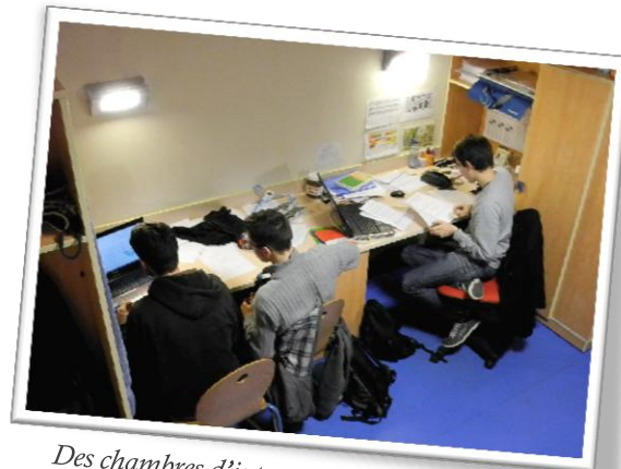
Des chambres d'internat très spacieuses et propices au travail en commun.

Les élèves originaires du Lycée et postulant ont de fortes chances d'être acceptés.